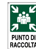
Punto di Raccolta 2